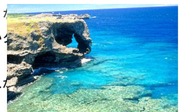
沖縄観光情報サイト沖縄沖縄物語

崖の上は天然の芝や海岸性の植物に覆われた緑の広場になっており、「万人が座れる毛（もう。野原のこと）」という名前の由来