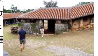
東京さんぽサイト

沖縄が本土復帰した1972年、後の人間国宝・金城次郎氏が那覇市壺屋から読谷村に移住。その後、軍用地の跡地利用としての「やちむんの里」に呼応した4人の陶芸家が1980年に共同登り窯を造って「読谷山焼」作りを始めた。1992年にはここで修行を積んだ若手陶工4人が読谷山焼「北窯」として独立した。現在、里内には14の工房があり陶芸家による創作と生活が一体行なわれている。