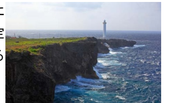
沖縄観光情報サイトたびらい

残波岬灯台（ざんぱみさきとうだい）は、日本国沖縄県の沖縄本島の中ほどにある読谷村の残波岬先端に立つ、白亜の大型灯台。その周辺は、沖縄海岸国立公園に指定され、30mもの断崖絶壁が約2kmも続く、雄大な景観が広がっている