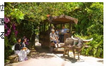
沖縄観光情報サイトたびらい

沖縄本島の中部・うるま市にある観光施設「ビオスの丘」。約7万5千坪の広大な敷地面積を誇り、四季折々の沖縄の生態系が見られるビオトープの植物園だ。散策路での森林浴に加え、水牛車や船に乗って時間を過ごすこともできる