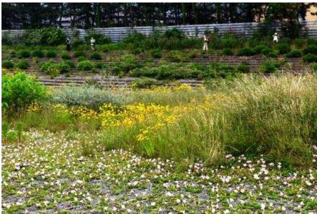
浜ひる顔などの花々が咲く海岸線を行く

10時に姫川橋を渡り、糸魚川市街に入り塩の道の基点を見学、見学と言っても案内板が立っているだけでそれを見る程度であったが。駅前の商店街には一部に雁木が残っていた。