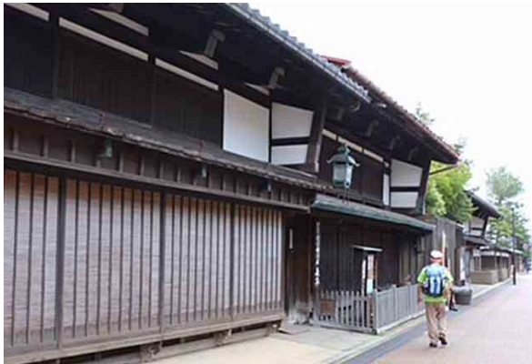
廻船問屋森家の前を歩く

9時35分 北前船廻船問屋森家を見学して、10時05分 森家を出発、古志の松原の自転車専用道路を歩く。途中から雨が降り出す。松並木の単調な道。