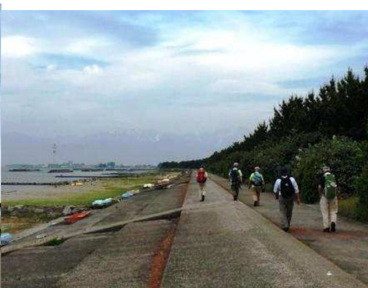
海老江海岸に行く