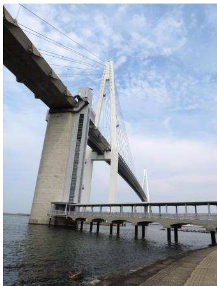
富山新港大橋(橋脚の右端がエレベータ)

新庄川橋を渡り奈呉の浦の海岸線に出て、帆船「海王丸」の帆柱を見ながら富山新港の入り口をまたぐ新港大橋を渡る。この橋は車用と人・自転車用の二層構造になっていて、非常に高いので人や自転車はエレベータを利用して上下する方式だった。