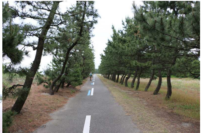
岩瀬浜の松並木 左手が海岸

12時16分 常願寺川の今川橋を渡り、途中のお好み焼き屋で軽い昼食、食堂を探しながら歩いたがまったくなく、魚屋でゆでたホタルイカを頂く。