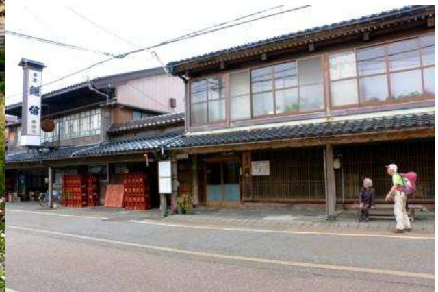
糸魚川市内の雁木(お酒は「謙信」)