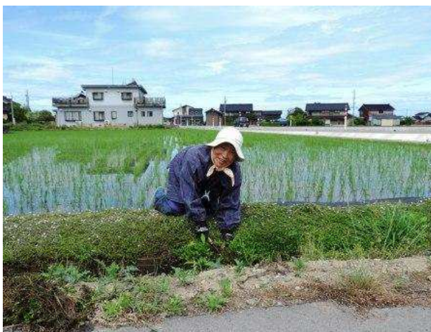
農作業をするバアチャン

赤川橋の手前で田圃に沿った水路の草取りをしているバアチャンと談笑、写真も取らせてもらう。