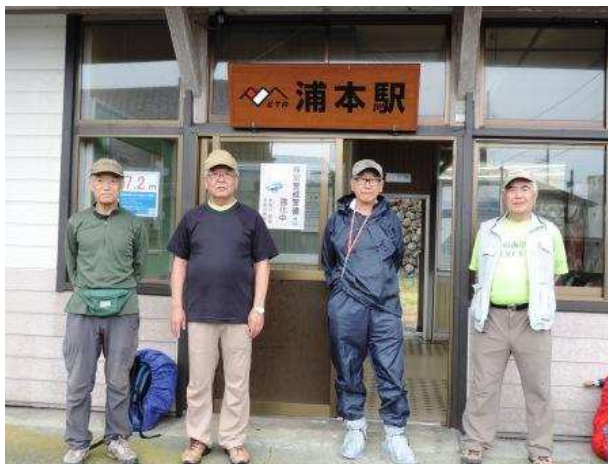
今回の歩行の東端「浦本駅」