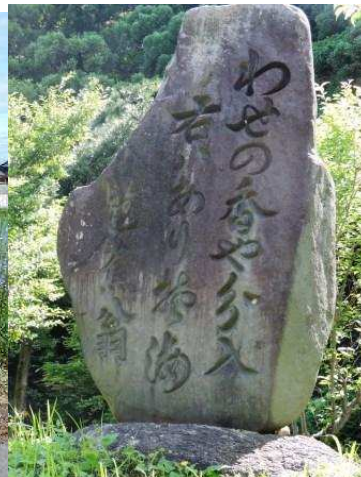
芭蕉の句碑「わせの香や分入る右はあり磯海」

泊の町の北側を通過して元屋敷で海岸線に出る。晴れたのは良いが気温も上昇、笹川橋近くの芭蕉の句碑の木陰で休憩、この辺りは芭蕉の句碑が多くある。