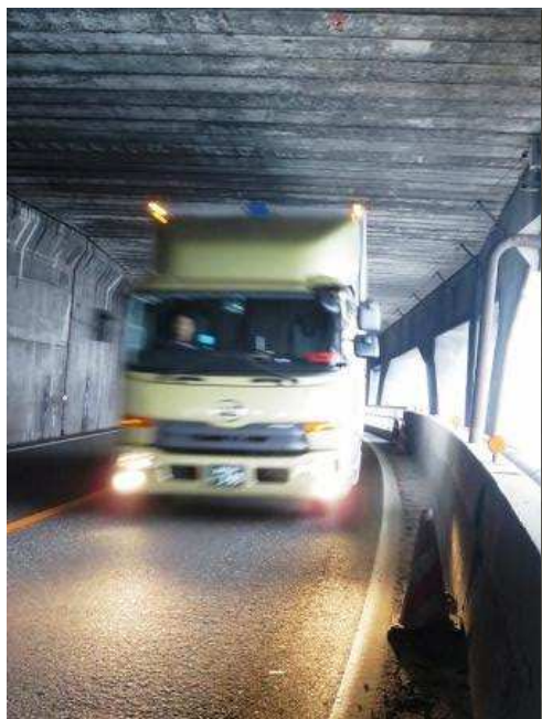
入り口付近から西方向を見る