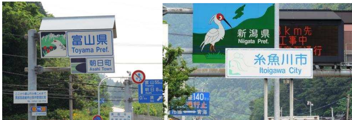
富山県から新潟県に入る

市振駅から逆(西)方向に歩く。越中宮崎駅との丁度中間点辺りに境関所跡があり、資料館で展示品などを見学。更に護国寺も見学、中々立派な庭園などもあり、昔は交通の要衝でかなり栄えていたものと想像できた。