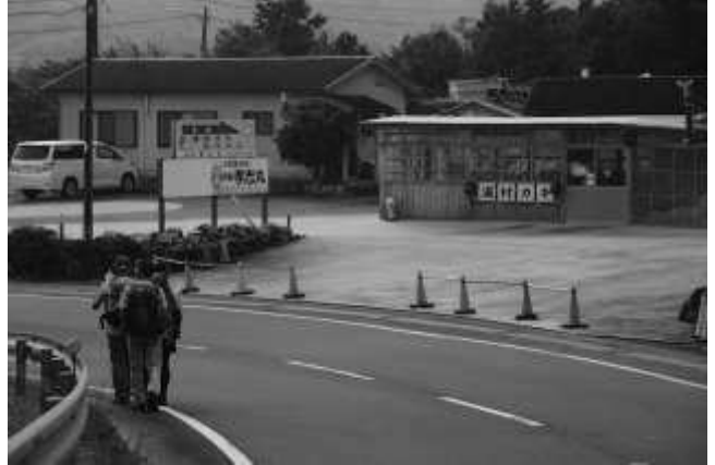
浦村牡蠣養殖場を横目に見ながら先を急ぐ (9:54)