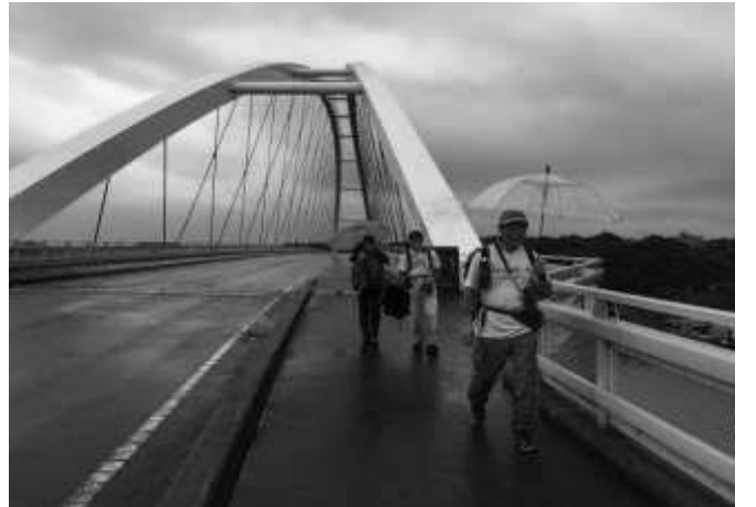
志摩大橋を見物して和具浦へ向かう