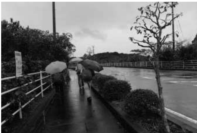
御座から和具へ向かう