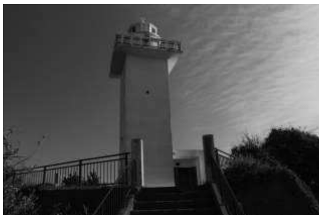
四角い安乗崎灯台 (9:00)