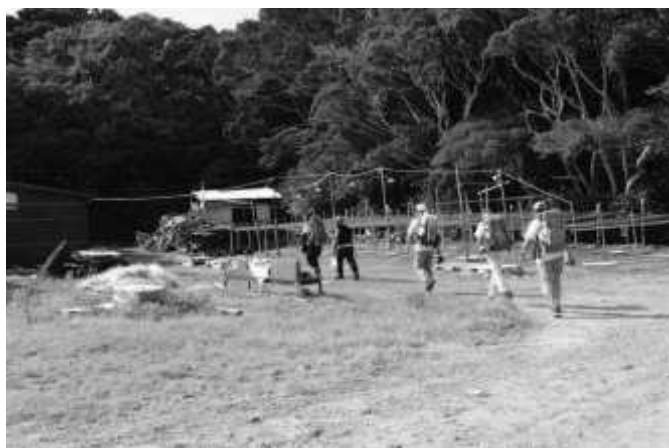
道案内をしていただいた 塚穴付近 (11:08)