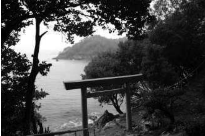
海に向かって建つ鳥居