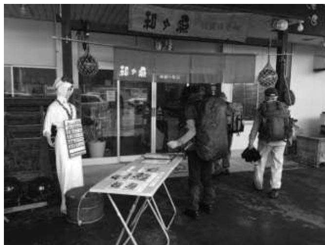
昼食に入った料理店