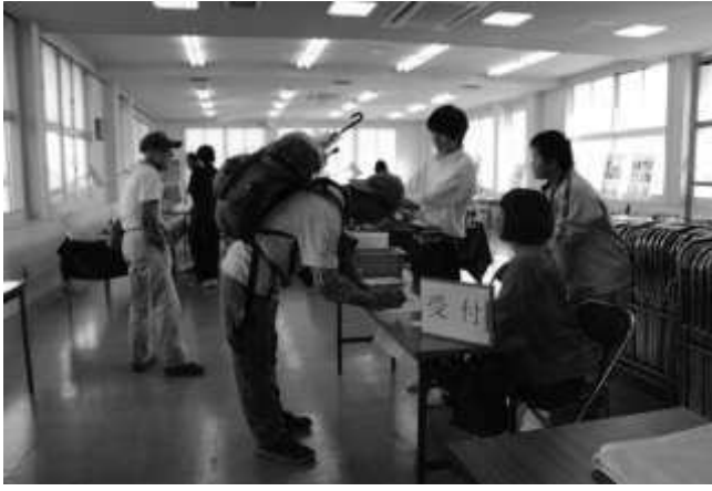
水産高校パールジュエリー作品展示会場