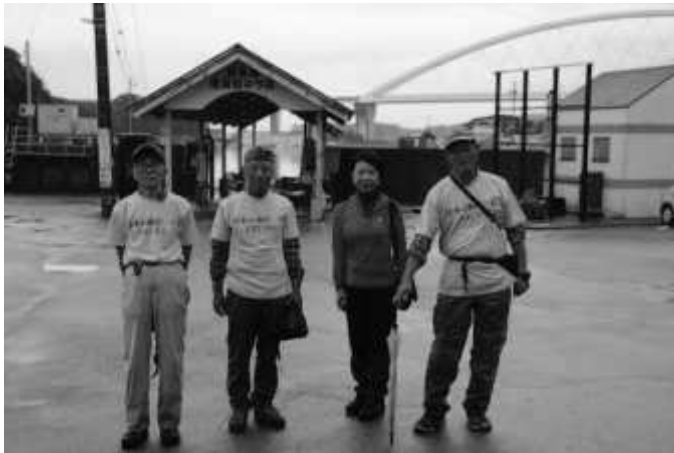
和具浦定期船乗り場にて