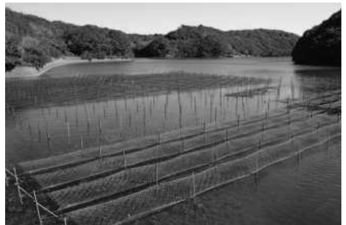
的矢湾アオサのり養殖場(11:01)