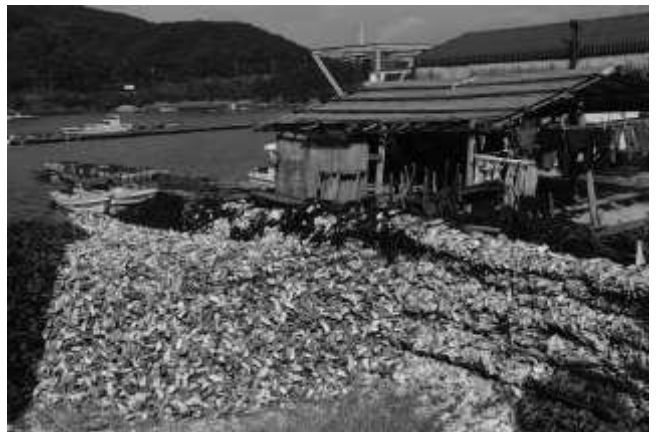
小屋横の牡蠣殻の山 (11:11)