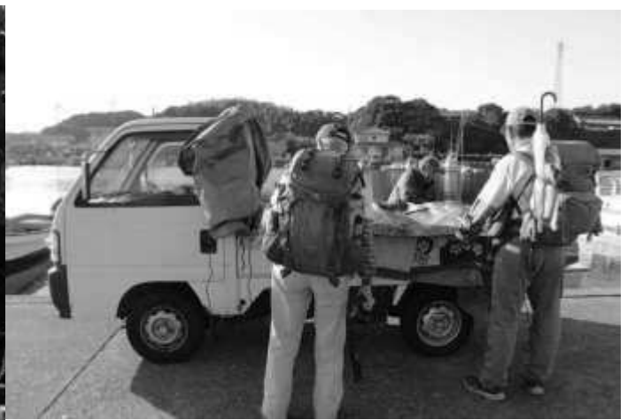
稚貝を毛布で保温して五ヶ所湾へ運ぶところ