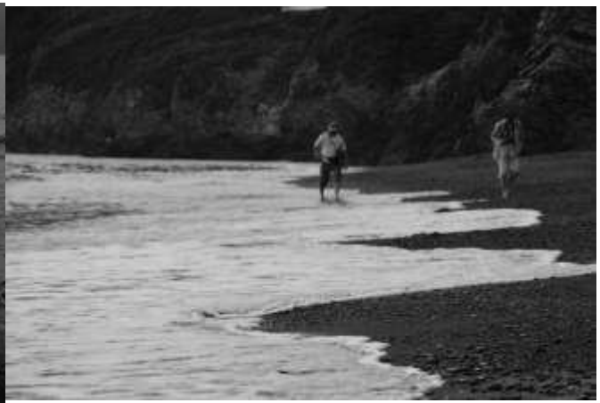
素足で砂浜を歩く