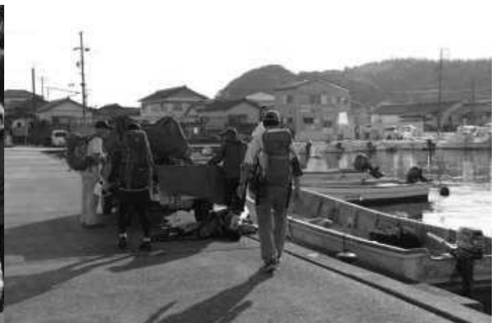
船越浦で漁師と出会う