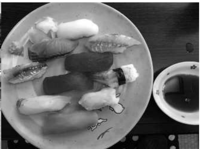
大黒寿司店のにぎり寿司