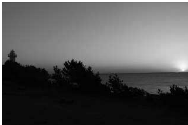
安乗灯台の日の出 (6:33)