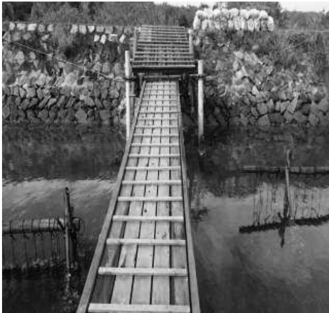
小さな港でカキ棚を見る