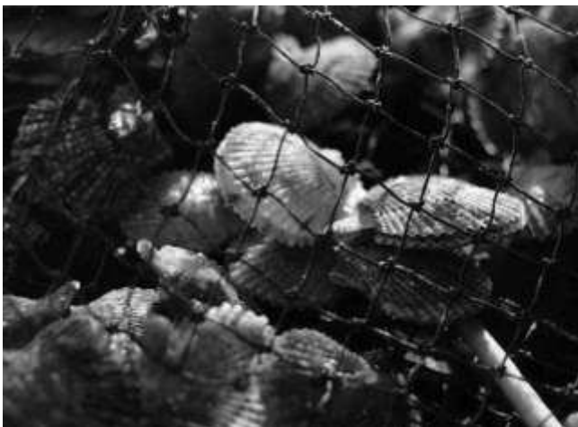
ヒオウギ貝の稚貝