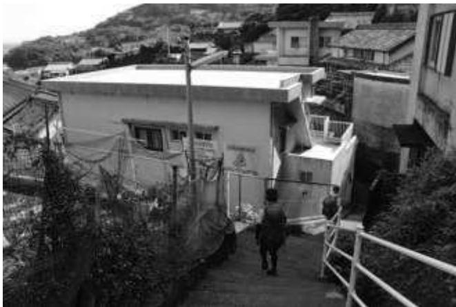
石鏡の浜へ急階段を降りる (12:30)