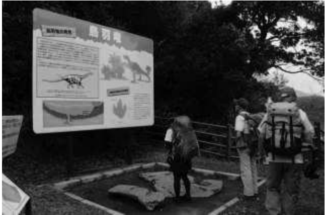
鳥羽竜足跡の化石レプリカに見入る (9:43)