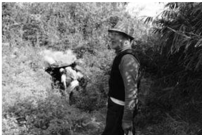
案内されたのは古墳でした (11:18)