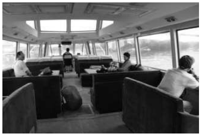
英虞湾クルージング