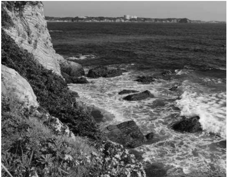
麦崎から大王崎方面を望む