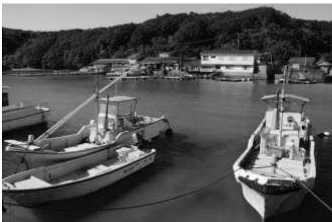
的矢佐藤牡蠣養殖場(11:31)