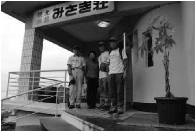
出発前の記念写真