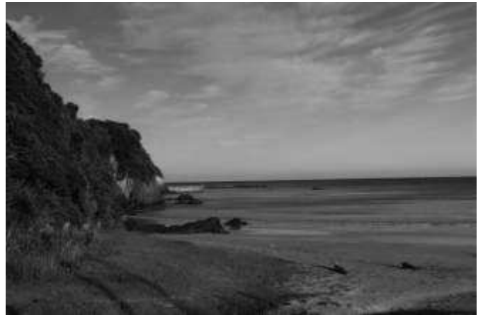
国府白浜海岸に到着 (14:43)