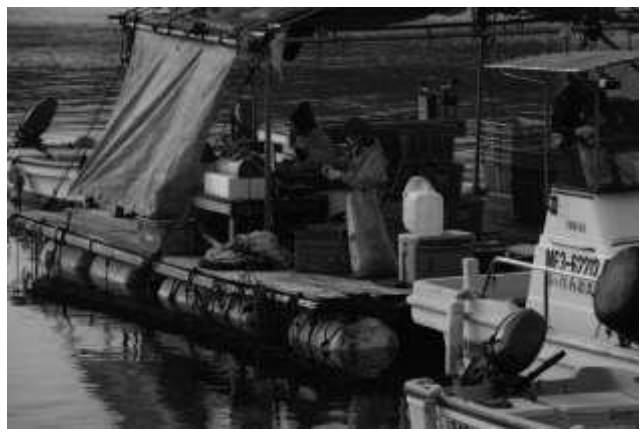
漁港で牡蠣殻を剥く作業