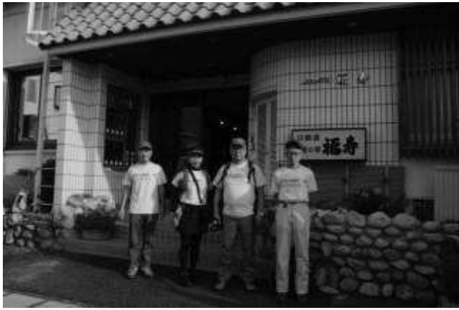
出発前の記念写真