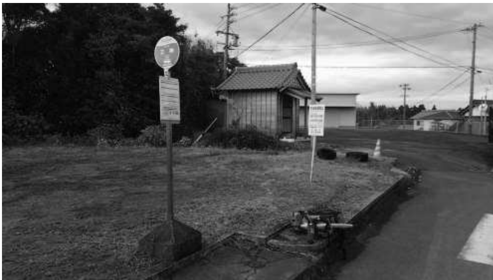
今回のゴール 立神バス停