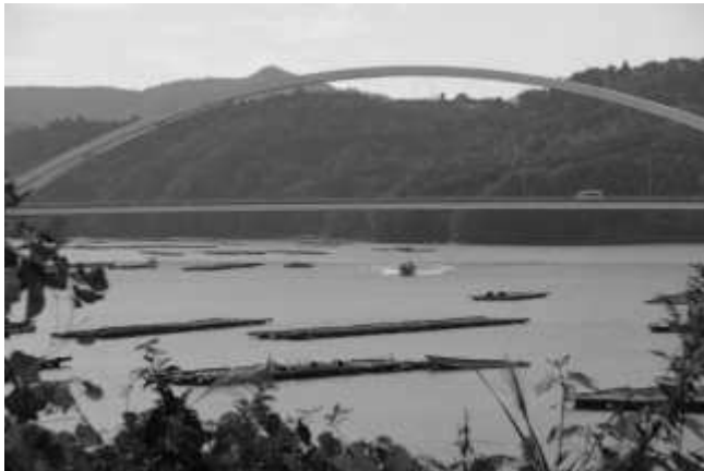
麻生の浦大橋が見えてきた (10:34)