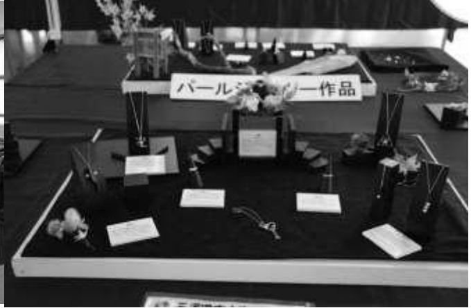
生徒が真珠養殖からデザイン・加工した作品