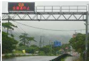
219号線全面通行止め