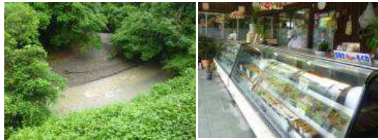
君が淵 日奈久竹輪今田屋／赤松本町

赤松町の中心を流れる無名の川に沿って緩やかな登り。赤松トンネル手前で標高130m。途中、君が淵という溪流があり、足を止める。