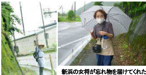
新浜の女将が忘れ物を届けてくれた

9:18 に旅館新浜を出発。昨夜の疲れで寝坊し、出発が遅れた。明治元年に建てられたという宿をゆっくり見たかったが、昨日の遅れを取り戻さなけ