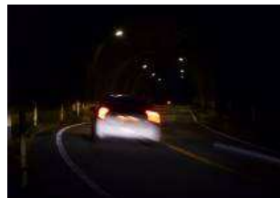
トンネルの灯が見えた

20:12 網津町の交差点で街灯にたどり着き、ようやく場所の確認が出来た。網津町交差点、今日の目標草道まで残り 1.7 キロ。