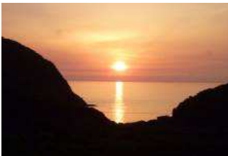
薩摩高城駅を通過後、日没

17:47 西方海水浴場に奇岩「人形岩」が現われ、更に行くと言の並木。19:20 日没。