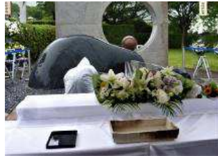
仁田団地公園の祭壇

翌日は朝から雨。宿で傘を借りて8時に出発。昨日見ておいた空き地に車を入れようとしたが、いまだ少し近くにと、スタッフに声をかけると、会場まで行ってよいとのことで、公園入口脇に車を止めることができた。