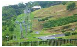
芦北海浜総合公園

悪天候で休園していたが、外から覗けたローラー・リ्यूージュ(小型そり)に乗って見たいと思った。200mほどの本格的なリフトを備えており、雪のない九州の工夫だと思った。