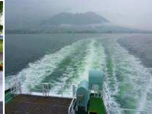
普賢岳に「たたえよ命」を吹いた