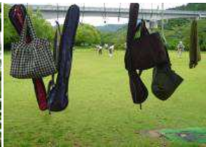
グラウンドゴルフ場