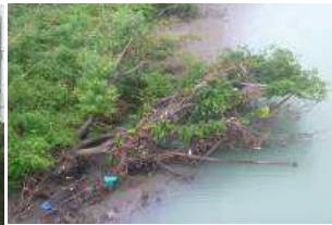
川岸に流木が引っかかっている

雨のため腰を下ろす場所がなく、ひたすら歩く。16:50 肥後高田駅前、17:12 八代南 IC 入口、18:35 日奈久温泉駅前。