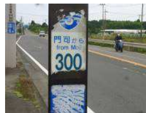
門司から300キロの表示