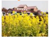
キララアジス道の駅