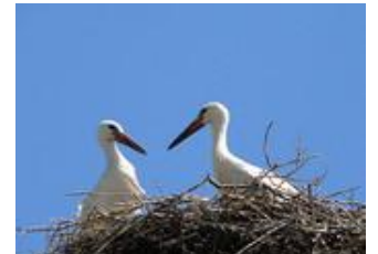
豊岡/このとり生息地