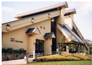
加藤文太郎記念図書館