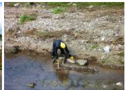
白杵川原で石を漁る人