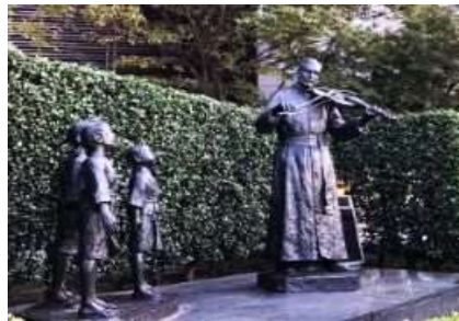
フランシスコ・ザビエル像