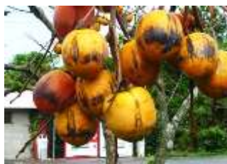
道端の柿を歩きながら頂く

ホテルAZ津久見店 07:35 出発= 08:00 セブンイレブン藤河内店~08 :15 佐志生小学校~09:55 九四フェ リーターミナル~11:45 土岐屋神社