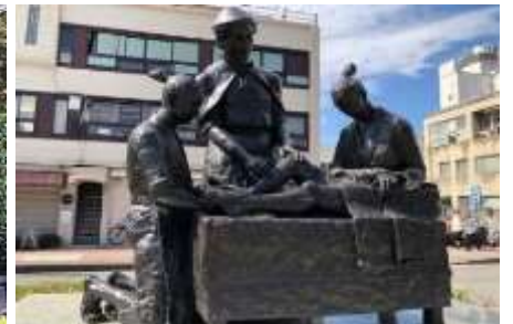
西洋医学発祥の地顕彰碑

銅像は県庁・大分城跡公園周囲の街の々におかれて、聖フランシスコ・ザビエルやローマに派遣された伊東ドン・マンショ像、西洋医学発祥