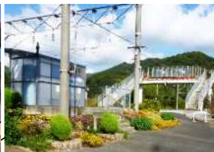
海崎駅（ホームしかない）