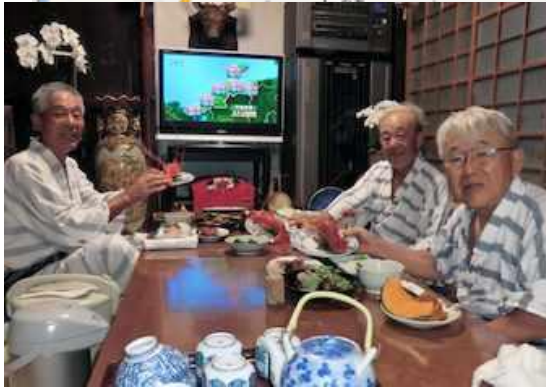
民宿吉田荘の夕食