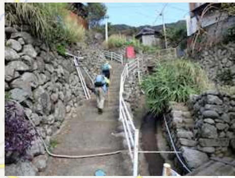
子浦から136号への階段