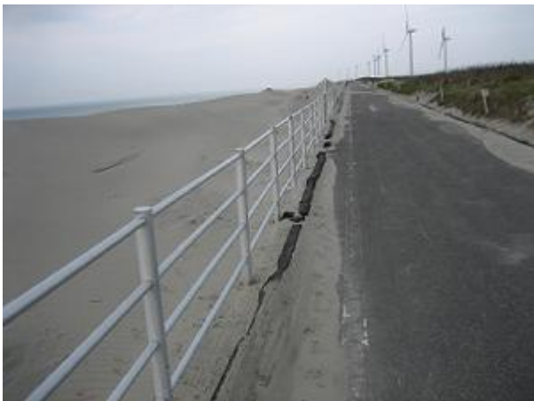
砂丘のサイクリングロード