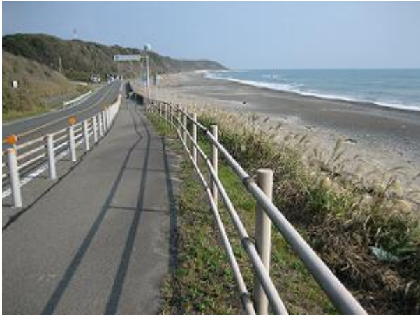
海岸サイクリングロード