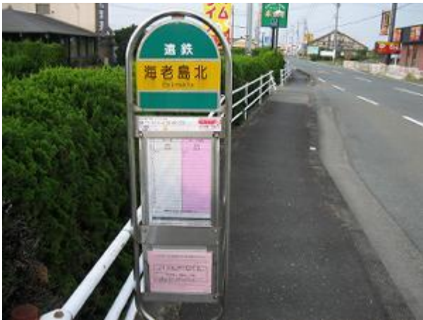
海老島北バス停が4日目の起点