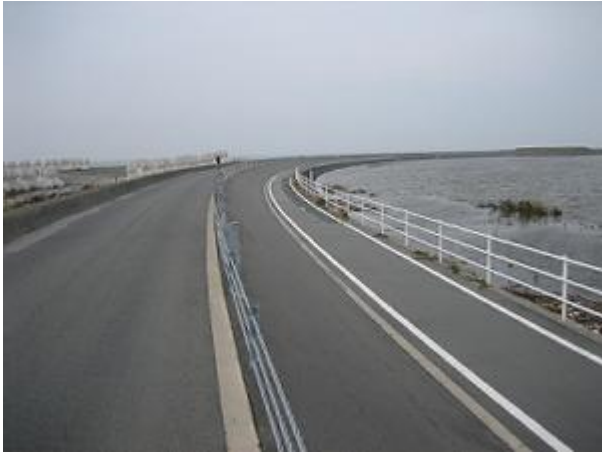
サイクリングロード(途中で工事中だった)